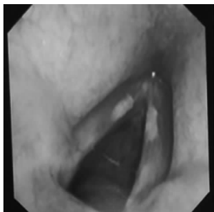
图 1 方某初诊喉镜所见